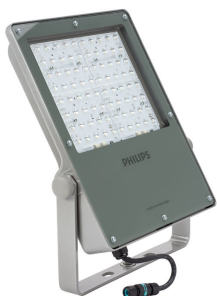
CoreLine Tempo large BVP130 strålkastararmatur