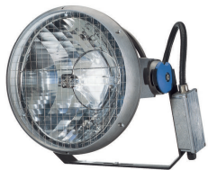
MVF403 - MASTER MHN-LA - 1000 W