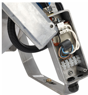
Elektrisk kopplingsdosa med e-tändare